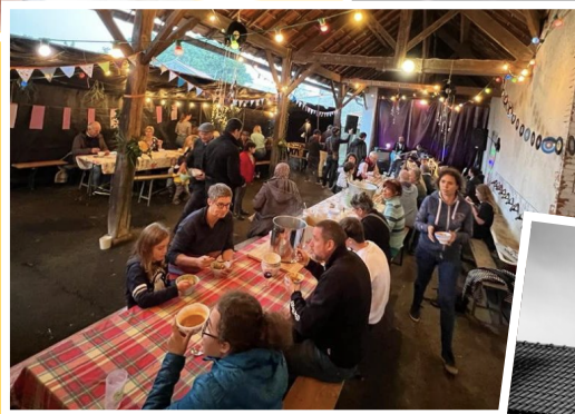
Chantier participatif - Fév 2023