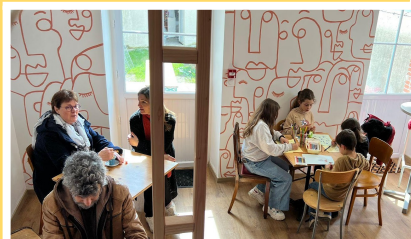
Inauguration - Avr 2023