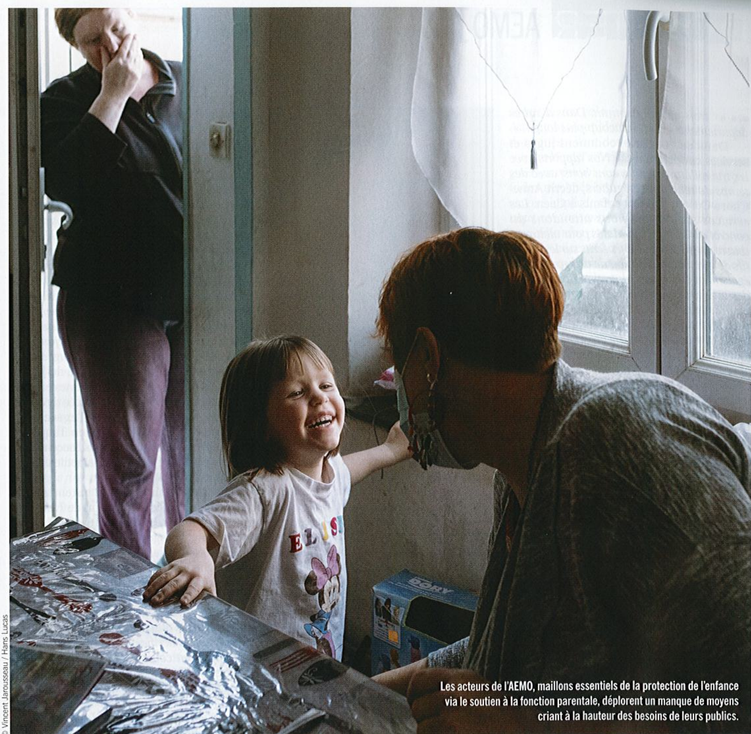
Les acteurs de l'AEMO, maillons essentiels de la protection de l'enfance via le soutien à la fonction parentale, déplorent un manque de moyens criant à la hauteur des besoins de leurs publics.